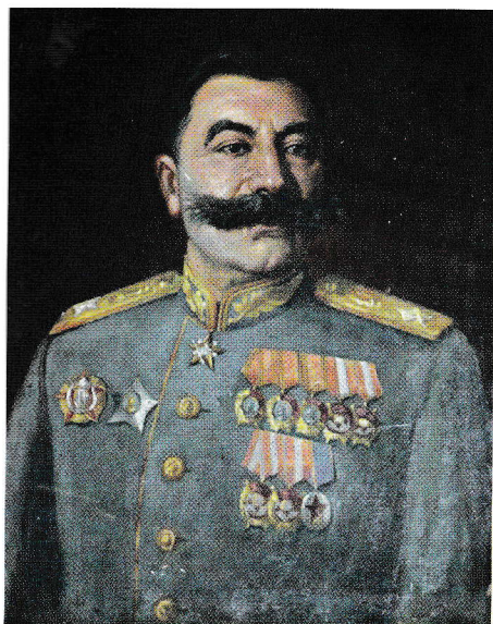
Ci-contre : portrait du maréchal Boudionny, en 1936, conservé religieusement au haras de la 1 re Armée de cavalerie dont il fut le commandant en chef. En bas : portrait d'un étalon du haras né en 1969.

tement, ou, pour ainsi dire, "à la française", c'est-à-dire qu'il ne croise pas les rênes de brides et de filets dans la main mais sépare de la distance d'une paume de main les deux rênes pour mieux en contrôler les effets sur la bouche du cheval. Rigoureusement comme Fillis l'avait enseigné à l'École de cavalerie. Il parlera longuement de ce maître-écuyer dans ses mémoires publiées en trois volumes entre 1958 et 1973.