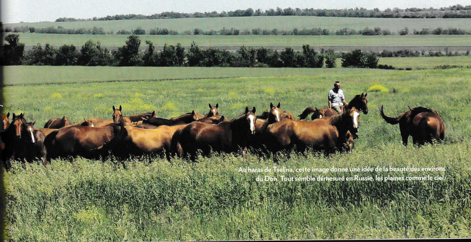
Au haras de Tselina, cette image donne une idée de la beauté des environs du Don. Tout semble démesuré en Russie, les plaines comme le ciel.