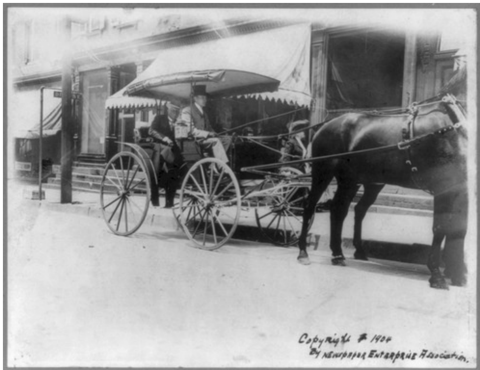
J D Rockefeller (1839 - 1937), assis à l'arrière

John Davison Rockefeller a le sens des affaires, Il met en place un trust colossal à travers tout le pays qui contrôle des raffineries, des flottes de wagons de chemin de fer, des pipe-lines, des entrepôts, et pour livrer les usagers, des chariots de livraison.